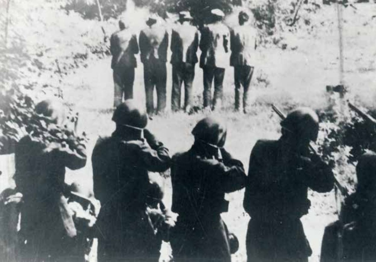
▲ Militari italiani fucilano cittadini del villaggio Dane nella Loska Dolina e Krisna Gora, 1942

la maggior parte degli stati europei mostrava scarso rispetto per i diritti delle minoranze etniche presenti sul loro territorio, quando addirittura non cercava in vari modi di conculcarli, ma ciò non toglie che la politica di «bonifica etnica» avviata dal fascismo sia risultata particolarmente pesante, anche perché l'intolleranza nazionale, talora venata di vero e proprio razzismo, si accompagnava alle misure totalitarie del regime.